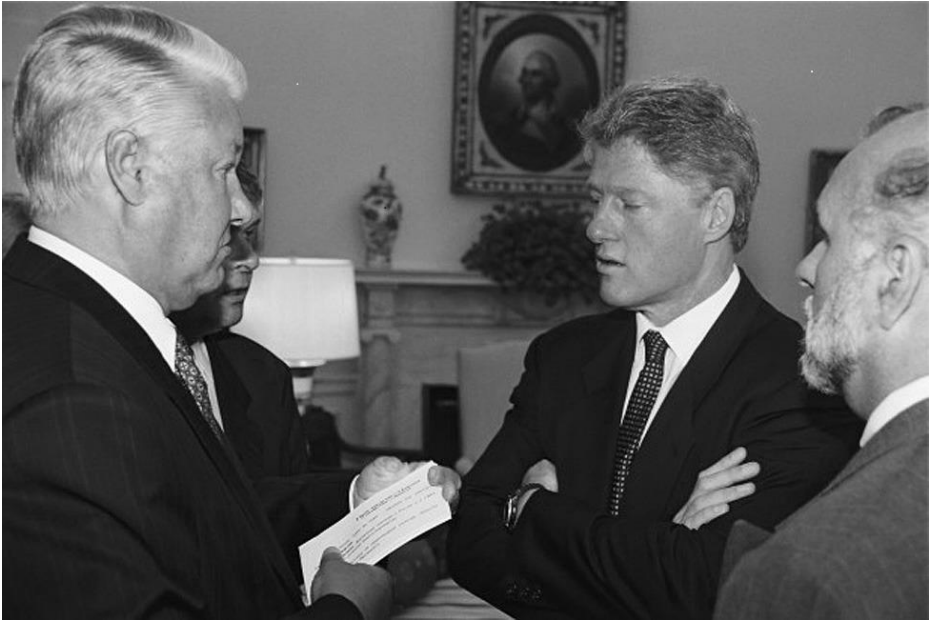
Clinton en Yeltsin in Washington, september 27-28, 1994.