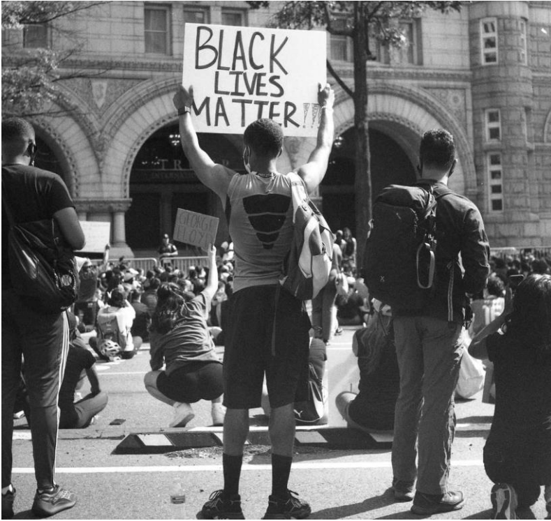
Black Lives Matter-demonstratie, zomer 2020.