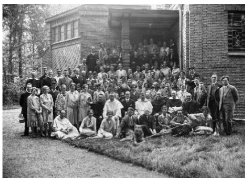
Afb. 3: Groepsfoto van Heemvaart uit 1928.

Ook het argument te willen investeren in de toekomst was belangrijk gezien de achtergrond van de katholieke emancipatie. Studenten vormden de toekomstige katholieke intelligentsia met een interne en externe symbolische waarde voor de hele zuil. Zo schrijft De Kruisbanier in 1928: ‘Den student, die zich nota bene geroepen acht, eenmaal een leider van het volk te zijn, maar in afwachting daarvan alvast begint met aan datzelfde volk een zeer slecht voorbeeld te geven!’ 31 Sobriëtas had dit door en investeerde, ondanks de soms karige beschikbare middelen, veel geld in de RKDI. Bij het overmaken van 75 gulden in 1927 (tegenover de jaarlijkse subsidie van soms slechts 17