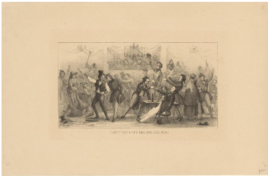
Afb 6: Feest bij de Leidse studentenvereniging Minerva, waar alcoholische drank in hoge mate vloeit. Afbeelding uit 1832 door Leendert Springer. Collectie Rijksmuseum Amsterdam, objectnummer RP-P-1951-223.