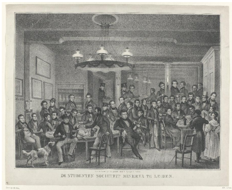
Afb. 5: Dronken studenten op een feest van de Leidse studentenvereniging Minerva, halverwege de negentiende eeuw. Het grootschalig drankgebruik onder studenten maakte deze doelgroep een prioriteit voor drankbestrijdingsbewegingen. Afbeelding uit 1841, door Alexander Ver Huell. Collectie Rijksmuseum Amsterdam, objectnummer RP-P-OB-88.502.

aanknopingspunten voor onderwijshistorisch onderzoek. Ten slotte verdienen zowel eerdere perioden, zoals de opkomst van drankbestrijding in de late negentiende eeuw, als latere ontwikkelingen aandacht. Voor de hand liggende suggesties zijn de democratiseringsbeweging van de jaren zestig en recentere initiatieven om alcoholgebruik te beperken. 55 ‘Keurige wereldbestormers’ met een sterke wereldvisie en een kritisch zelfbeeld, dus.