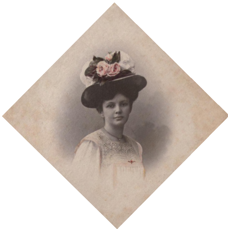
Afb. 2: Een Indo-Europese vrouw

In eerste instantie is deze koloniale ideologie ook in 'Een Indisch kind' en in Het mooiste meisje aan boord te vinden: door de Europese opvoeding van haar grootmoeder worden de Aziatische invloeden bij de lichtgekleurde Indo-Europese Minie uitgewist. Geheel volgens de koloniale normen van die tijd wordt in de novelle Minies moeder naar de achtergrond gedrongen en zorgt Minies vader ervoor dat zij een andere man vindt dan haar eerste geliefde, baron Van der Eyken. In het slot van de roman is die rol weggelegd voor Minies Javaanse moeder.