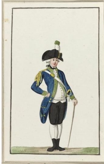
Afb. 1: Montering (uniform) van een Haarlemse bombardier, ca. 1787.